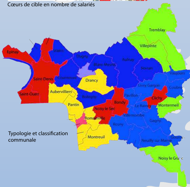
Typologie et classification communale